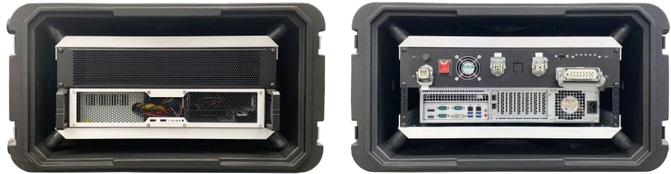
SecuScan ® ScanStation (vista frontal y trasera)